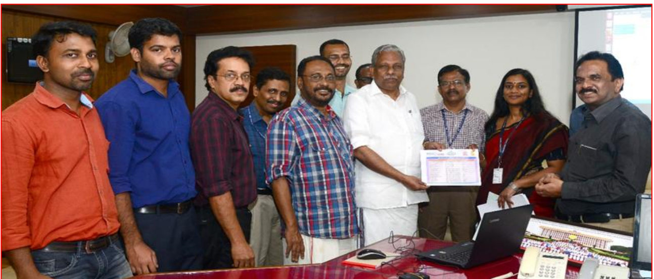
Photo: Shri. A C Moideen, Hon'ble Minister of Local Self Governments during the inaugural programme.

Grievances can be submitted directly to the District Offices of Life Mission. eDistrict facilitates the Life Mission officials with a work flow application to record the action taken after necessary investigation and to intimate the action taken report to the applicants online.